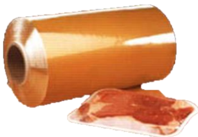
Przemysł spożywczy – opakowania i blaty robocze