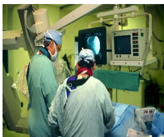
Służba zdrowia - odzież ochronna i sale zabiegowe