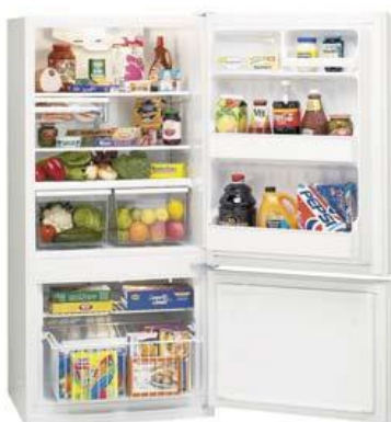
Lodówki i zamrażarki