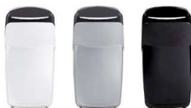
Standardowe opcje kolorystyczne