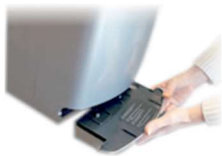
Zbiornik na wodę