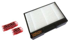
Filtr HEPA-13 z kostką ZS